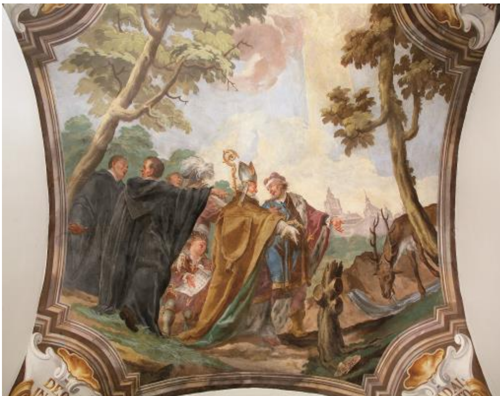
3. Jan Karel Kovář, ambit v prelatuře, nástropní malba (cca r. 1740), foto © M. Mádl. Zde již vidíme pařez (břevno) vedle studánky, z níž pije jelen; vyobrazení ze stejné doby, kdy svou knihu publikuje Ziegelbauer.

4. J. Klein, sousoší v pavilonu Vojtěška (1749), pařez (břevno) je (nakolik je to ze ztvárnění zřetelné) ve studánce, jelen pijící z pramene. Foto neznámého autora, cca 1925.