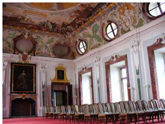
Oecus Mariae Theresiae

Supra pulcherrima opera udo illita cernuntur, quorum in primo monasterium Brevnoviense diutius aequo neglectum, ideoque anno MDCLXIII o in statum pristinum redigendum, villam deliciarum c.n. "Stella", coenobium servitorum in monte Albo situm, in altero pugnam apud Vahlstadium in Silesia contra Tataros commissam, in qua filius sanctae Hedvicae occisus est, in tertio eandem divam ibidem monasterium condentem, in quarto amplissimum monasterium Braunense, in