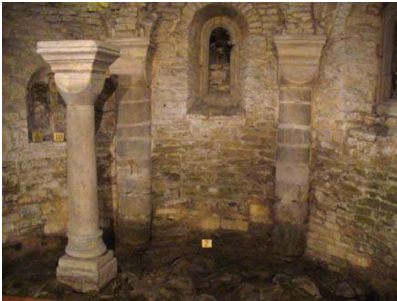
Romanica ecclesiae crypta

Ioannis XV et Bonifatii IX, pontificum Romanorum, ornata admirati omnem animi attentionem ad cameram navis perbelle pictam intendatis. Videbitis sanctum Adalbertum quinque sanctis fratribus cinctum, horologium, quo tempus ad orationes ac preces proferendas aptum designabatur, Alexium et Bonifatium, primos huius ecclesiae patronos, sanctam Crucem adorantes una cum archangelo Michaeli diabolum depellenti, sanctos Benedictinos, inter quos Anastasius, primus archiepiscopus Strigoniensis, Gaudentius, primus archiepiscopus Gnesnensis, Guntherus, Procopius, Adalbertus, de quibus iam plurima verba feci, numerantur; postremo, nisi organa Chilianii Ignatii illius Dientzenhofer restituerentur, sanctos Bohemiae defensores spectaretis; quorum in grege sancti Ioannes Nepomucenus, Adalbertus, Gaudentius, Venceslaus, Lidmilla, Sigismundus et una cum divo Boleslaus Pius, nobilis coenobii conditor, iure meritoque sunt. Imagines Boleslai Pii, Bretislai, Premyslai Ottacari huius nominis primi, Ioannis Luxemburgensis, Rodulphi II, Ferdinandi II Habsburgensium, principum, regum, imperatorum, qui Brevnovienses suppeditarint, emblematis continentur. Hisce magna cum patientia exauditis ecclesiam parumper admiremini, quam primum, ne tempus deficiat, ex ecclesia egrediamini, deorsum in hypogeum eatis, et sepulcra antiquissima, Romanicam templi cryptam, conclavia subterranea variis temporibus aedificata oculis perlustretis.