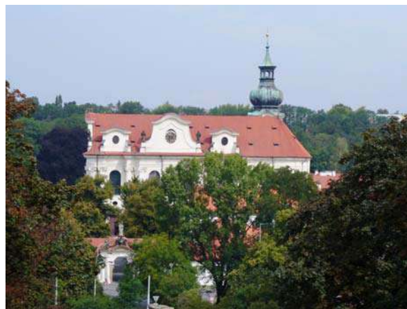
Monasterii porta et ecclesia S. Margaritiae

Boleslaus Pius, princeps Bohemorum, et Adalbertus, episcopus Pragensis, saeculo decimo exeunte tignum in fonticulo, qui in horto monasterii reperitur, nacti locum ad coenobium condendum admodum opportunum invenerunt, quippe haud longe arce Pragensi positum, in qua iam diutius quam mille annos gubernatores rei publicae ecclesiaeque antistites sedes habent; qui locus adhuc, quamvis permultis aedificiis cinctus propemodum in sinu urbis sit, tranquillitatis plenus est.