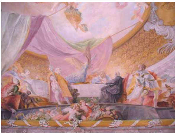
Miraculum beati Guntheri in camera depictum

Paucis abhinc temporis momentis oecum Mariae Theresiae Habsburgensi, Bohemiae Hungariaeque reginae, dicatum ingressi fortasse quaeritis qua de causa his in aedibus id genus conclave sit. Paucis enodabo; nam Maria Theresia “in regem Bohemiae gloriosissime coronata anno 1743” , quae verba parieti inscripta ipsi videtis, omnia huiusce monasterii privilegia confirmavit. Parietis ergo ad septentriones vergens imaginibus imperatoris Caroli VI, Mariae Theresiae, filiae eius, una cum Iosepho, filiolo suo, imperatoris Iosephi I ornatus est; parieti vero ad meridiem spectanti imagines imperatorum Ferdinandi II, Francisci Stephani Lotharingi, mariti Mariae Theresiae, Leopoldi I ornamento sunt. Media in camera miraculum ita ut in Vita beati Guntheri eremitae traditur depictum est; cum enim Guntherus in austeritate vitae perseveraret, et exemplo plurimos ad viam veritatis inclinaret, fama eius usque ad Stephani, regis Hungarorum, aures pervenit; qui illum venerabilem cognatum suum cognoscere concupivit legatosque haud indignos misit, qui eum ad aulam suam comitarentur. Guntherus autem bis se in regiam venturum denegavit, sed tertio adnuit legatisque admodum