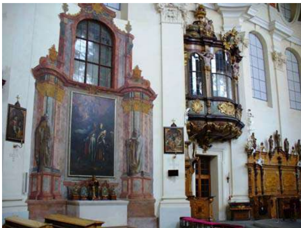
Altaria sancti Adalberti

Prima deinde altaria parieti ad septentriones vergenti imposita divoque Venceslao, patrono ac perpetuo Bohemiae principi, dicata ornantur pictura, in qua caedes eius, quam antiquis iam temporibus Christianus qui dicitur enarravit, depicta est. Boleslaus enim, frater Venceslai minor natu, saeculo decimo ineunte principatum assequi cupiens presbytero