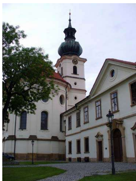
Ecclesia S. Margaritiae et praelatura

Haec quorum in medio sumus, non semper eadem fuere: circa nos enim non solum mola alata post collegium alumnorum academicorum caelo imminens et piscinae sub monasterio usque ad tempora nostra servatae, sed etiam braxatoria, officinae laterariae, agri fecundi, pomaria uberrima, horti oleracei, viridaria iacebant; multa, inquam, multa temporis progressu periere; attamen meditullium harum rerum omnium spectare nobis et coaetaneis nostris licet; itaque porta monasterium ingredi, hortos tempore coenonistarum destructos, horrea frumentaria, granaria, diaetas animum oblectantes, aedes celeberrimas admiramus. Quid in medio? Quid eminet? Quid pietate eximia egregiaque forma excellit? Mente fingatis arborem pulcherrimam frondibusque vestitam, cuius in medio immensus invisusque pietatis flos cernitur. Nequaquam enim forte fortuna, credo, contigit ut hoc monasterium tamquam lignum plantatum secus decursus aquarum conderetur, ut fructum suum daret in tempore suo et folia eius numquam defluerent.