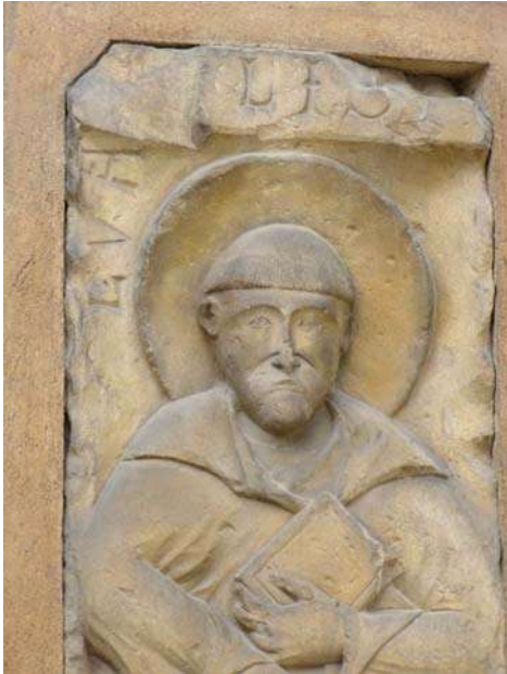
Beati Guntheri lapis sepulcralis in parietem ecclesiae exteriorem impositus

Altera altaria sanctae cruci dicata sunt, erga quam saeculo duodevicesimo praecipua religione fratres Benedictini tenebantur; cuius in medio imago Christi morientis atque exspirantis et Mariae Virginis Dolorosae cum corde gladio doloris ingentis percusso videtis. Oculos deinceps vestros ad ambonem sacri concionatoris et ad eam aram prope presbyterium sitam tollite in qua sanctus Adalbertus, episcopus Pragensis, et Boleslaus Pius, princeps Bohemorum, monasterium condentes depicti sunt; hōc autem loco pro tigno truncus et superiore in parte sanctissima Trinitas Anastasium et Gaudentium, monachos Brevnovienses, in caelum accipiens cernuntur.