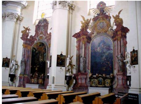
Altaria sanctorum Benedicti et Othomari