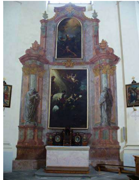
Altaria beati Guntheri et sancti Procopii

Tertia altaria beato Gunthero et sancto Procopio dicata sunt, propterea quod tantum beatis aras consecrare nefas habebatur. Guntherus igitur summo loco Thuringiae natus, dignitate et meritis illustris, insuper propinquus imperatoris Henrici huius nominis secundi et Stephani, regis Hungarorum, fuit; quin etiam publicis in legationibus obeundis diutissime versatus pacem inter imperatorem Henricum et Bretislaum, principem Bohemorum, qui Gnesnam ceperat exspoliaveratque, prospere conciliavit; paulo post sacrae familiae instituta in Altacha Inferiore professus novum coenobium condidit seque in silvam Gabretam recepit. Posthac Bretislaus cervum desuper missum secutus Guntherum senem in cellula quadam invenit, sermonemque cum eo habuit. Ille autem se mox supremum diem obiturum professus optavit ut Brevnovii sepeliretur; idcirco postridie summo diluculo princeps Bohemorum Severum, episcopum Pragensem, eo consilio arcessivit ut Guntheri vitam aeternam corporis et sanguinis perceptione muniret; quo quidem facto Guntherus immaculatum Deo spiritum tranquille reddidit. 3