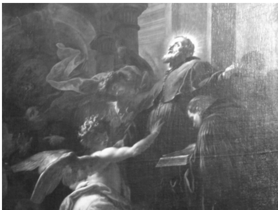
Sanctus Benedictus in caelum ascendit

Altaria deinde divi Benedicti videtis, qui anno CDLXXX o Nursiae natus Romae operam studiis dedit, omnia huius vitae blandimenta deseruit, despexit, conculcavit, se ad fidem excolendam, ad monasteria apud Sublaqueum condenda contulit, posthac precibus